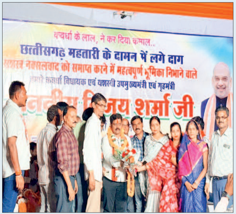
केन्द्रीय गृह मंत्री अमित शाह द्वारा निर्धारित समय-सीमा के अनुरूप छत्तीसगढ़ में नक्सलवाद के विरुद्ध अभियान में उल्लेखनीय सफलता हासिल की गई है। प्रदेश के गृह मंत्री विजय शर्मा के नेतृत्व में सुरक्षा बलों ने प्रभावी रणनीति अपनाते हुए नक्सल गतिविधियों पर कड़ा प्रहार किया। इस दौरान श्री शर्मा ने स्वयं कई नक्सली नेताओं से चर्चा कर उन्हें आत्मसमर्पण के लिए प्रेरित किया। श्री शर्मा ने कहा कि यह सब प्रदेश की जनता के सहयोग और विश्वास से संभव हो पाया है। इस उपलब्धि से राज्य में सुरक्षा व्यवस्था मजबूत हुई है और आम जनता में विश्वास बढ़ा है।

है। उन्होंने यह भी आश्वासन दिया कि सरकार आम जनता की सुरक्षा, विकास और विश्वास को सर्वोच्च प्राथमिकता देती है तथा भविष्य में भी इसी प्रतिबद्धता के साथ कार्य करती रहेगी। कार्यक्रम का समापन राष्ट्रगान के साथ हुआ, जिसमें सभी उपस्थित नागरिकों ने एकजुटता और प्रदेश की प्रगति के प्रति अपने संकल्प को