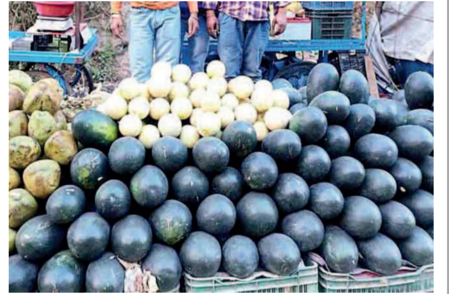
कवर्धा। लगातार बढ़ रही गर्मी के साथ नगर के बाजार में बढ़ी मौसमी और रसीले फलों की आवक।